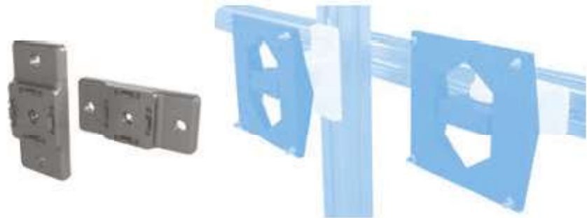
Adapterplatte 40 höhenverstellbar Adapter Plate 40 Height Adjustable